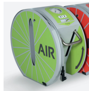
Fot-pumpe med sidespor.