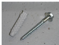
M8X60SKRUE + PLUGG 12X60