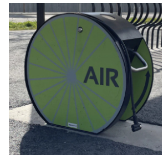
Fot-pumpe uten sidespor.